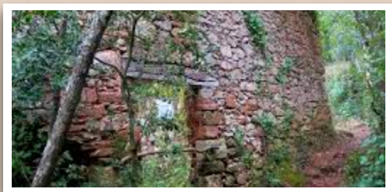
Antic forn de calç

Aquest recorregut, creat el passat 2002, visita un dels miradors més privilegiats de l'entorn de Caldes: el Turó de Casuc. El turó se situa per sobre del Morro de Porc, des d'on tenim una magnífica panoràmica amb les vistes sobre Sant Feliu de Codines, el Montseny i els cingles de Bertí. La ruta també passa molt a prop de les restes d'uns antics forns de calç que hi ha a la serra del Farell.