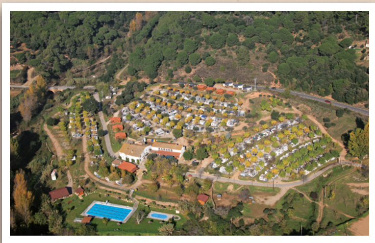
Càmping El Pasqualet