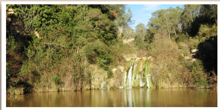
Gorg de les Elies

Sentier giratoire que suit la base du PR-C 9 mais qui n'a pas besoin de faire le chemin en arrière jusqu'à Caldes. Une fois nous sommes arrivés à le dénommé Gorg de les Elies à travers du PR-C9, au lieu de monter à Santa Maria del Grau, nous pouvons retourner à Caldes en suivant le cours du ruisseau. Nous traverserons aussi les anciennes carrières de Caldes, où, à la fin du XIX siècle on a fait milliers de pavés qu'étaient transportés avec des lourds chariots tirés par des bœufs jusqu'à l'station de train de la ville pour les porter à Barcelone et d'autres lieux avec le chemin de fer.