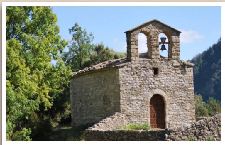
Ermita de Santa Maria del Grau

Tout près de Caldes passe le GR-5 qui relie Canet de Mar avec Sitges par l'intérieur. Le PR-C 9 c'est un sentier de petit parcours que relie Caldes avec ce GR-5 à la hauteur de la chapelle de Santa Maria del Grau. Dès la Serra Llista nous pouvons apprécier les magnifiques panoramiques ou nous arrêter à Sant Sebastià de Montmajor.